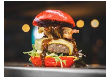
Topburgerläden kämpfen um den Titel „Bester Burger“