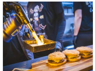
Berlin - der ideale Ort für die Premiere des Foodtruck-Events