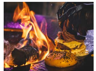
Alle Lebensmittel stammen aus nachhaltiger Herstellung