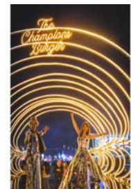
Startschuss am 9. Mai 2024 auf dem RAW-Gelände in Berlin